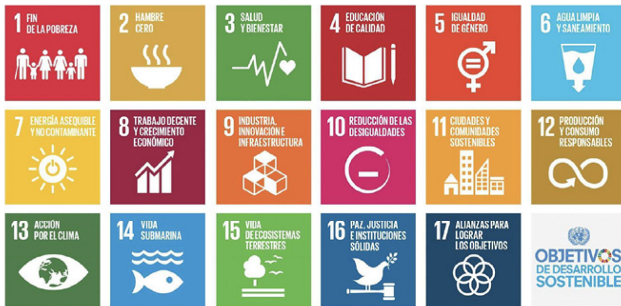
Figura 1. Objetivos de desarrollo sostenible, UNESCO (2017).

chos humanos y proteger el planeta ( UNESCO, 2015 ). En este sentido, desde la ONU se reconocen tres grandes dimensiones de acción en este campo: económica, social y ambiental, a partir de las cuales se sugieren los 17 objetivos de desarrollo sostenible (ODS) ( UNESCO, 2017 ) que abordan una amplia variedad de temáticas (Figura 1):